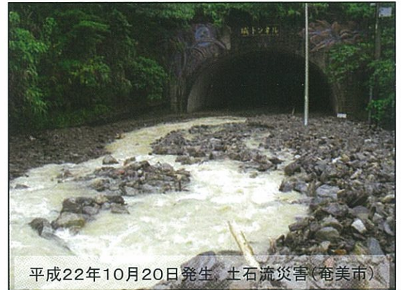
平成22年10月20日発生 土石流災害(奄美市)