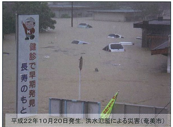
平成22年10月20日発生、洪水氾濫による災害(奄美市)

きよねんの十がつかはつか、わたしのすんでいる住用町に大あめがふりました。わたしは、そのときほいくしよのねんちようぐみでした。そのひは、あさから、ずっとあめがふっていました。ひるのごはんのあと、あそんでいて、いり口のかいだんの二だんめに、どしゃがながれてきていました。わたしは、びっくりして、せんせいにしえにはしていききました。