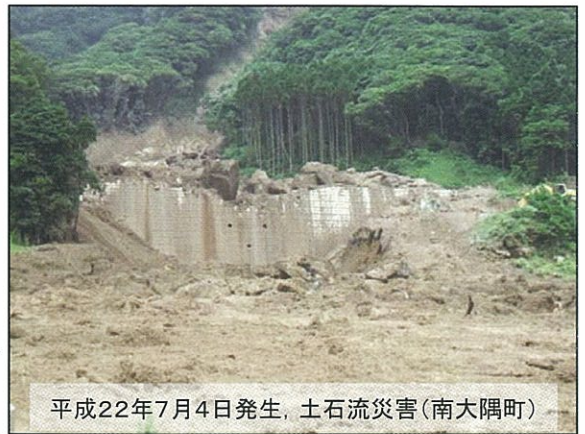
平成22年7月4日発生、土石流災害(南大隅町)

ぼくは、一年前に土砂くずれにいました。その土砂くずれは、大雨が続き起きたものです。土砂くずれが起きた日、僕は目をうたがいました。実は、四年前にも台風のえいきょうで土砂くずれを経験していましたが、それ以上に大きくくずれていたので。