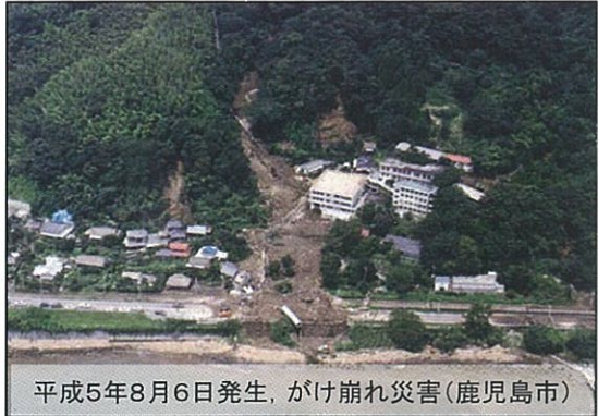
平成5年8月6日発生、がけ崩れ災害(鹿児島市)

私の祖父は吉野町の花倉に住んでいます。祖父宅の裏山から錦江湾を見下すと雄大な桜島がみえ、絶好のロケーションです。