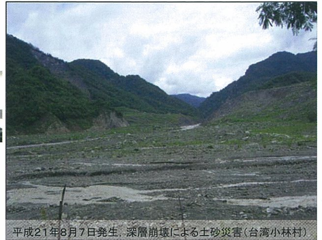
平成21年8月7日発生、深層崩壊による土砂災害(台湾小林村)

そうしたことをすることで、開発途上の国は発展し、もっと平和で豊かな世界をつくることができるのではないかと。