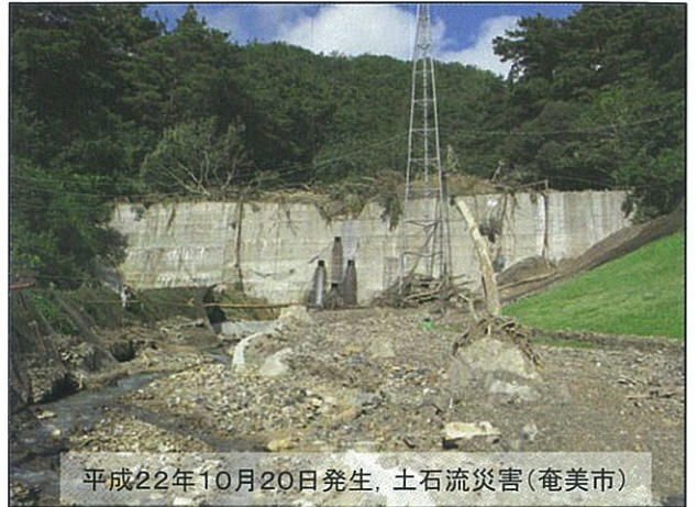
平成22年10月20日発生、土石流災害(奄美市)

今、奄美大島は復興するために、たくさんの場所で工事が行われています。みんな復興目指してがんばっているので、僕は僕にできることをこれからも積極的にを行い、奄美大島が一日でも早く、もともとのきれいな海や山などの自然でいっぱいの奄美大島に戻ってほしいです。