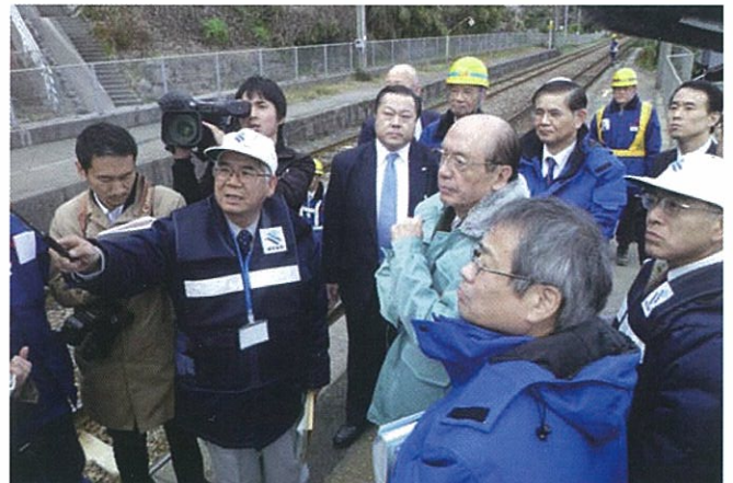
鹿児島地域振興局宇都博美建設部長から説明を受ける前田武志国土交通大臣