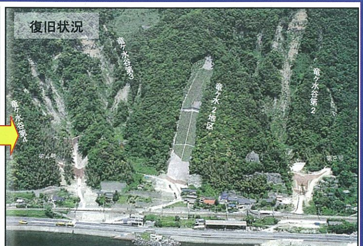
平成5年鹿児島豪雨災害時の竜ヶ水地区の被害状況と復旧状況